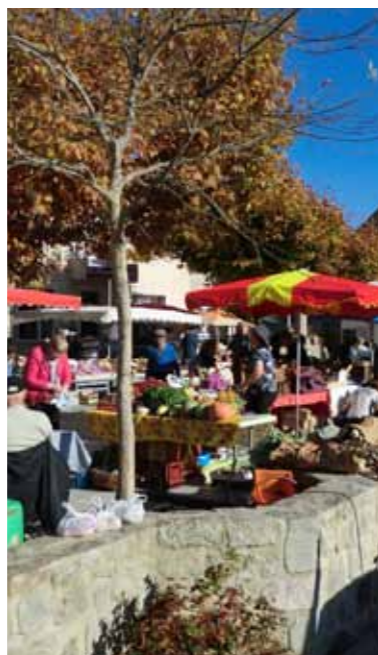
Le marché des producteurs

Superbement organisé par le comité des fêtes du 30 octobre au 1er Novembre, le festival nous a proposé une belle palette artistique. Dès le vendredi soir nous avons pu apprécier Barbara Deschamps auteur compositeur interprète de grande qualité. Le samedi spectacle pour les enfants l'après-midi et soirée irlandaise avec Les Mandrinots. Dimanche, marché des producteurs sur la place, randonnée avec les Légrémis, « animations surprises » par la Compagnie des Chimères. Conférence sur l'abeille noire des Cévennes, il y en avait pour tous les goûts. Bien évidemment durant ces trois jours les œuvres des six exposants étaient offertes à la curiosité des visiteurs. Le jury du festival a attribué la châtaigne d'or à Barbara Deschamps et la châtaigne d'argent à Guy Chambon pour l'ensemble de son œuvre (lire par ailleurs). Un grand bravo à tous les bénévoles et rendez-vous en 2016 pour la trentième édition.